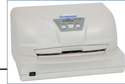
Nadeldrucker (Tally 5130)