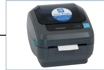
Thermodirekt-Drucker (Zebra GK420d)