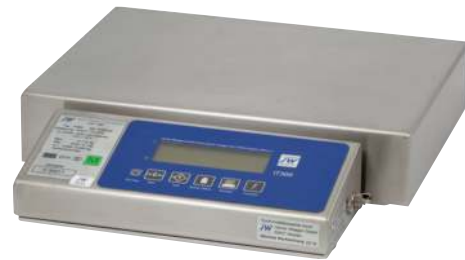
Kompaktwaage für Handeingabe