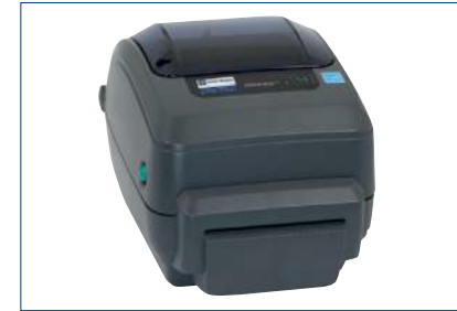
Thermotransfer-Drucker (Zebra GX430t)