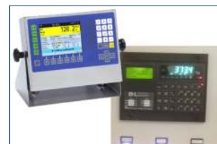
Wir empfehlen: IT8000e und DOS2000M