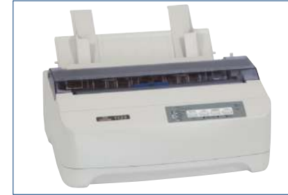
Nadeldrucker (Tally 1125)