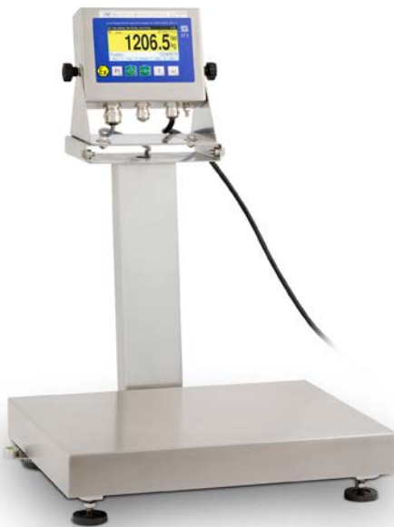
Waage für Handeingabe