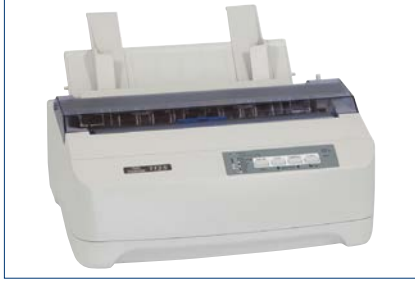
Nadeldrucker (Tally 1125)