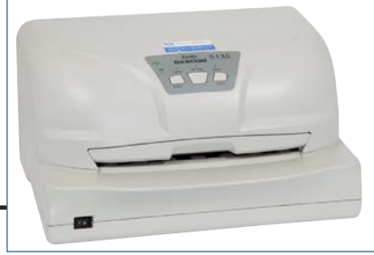
Nadeldrucker (Tally 5130)