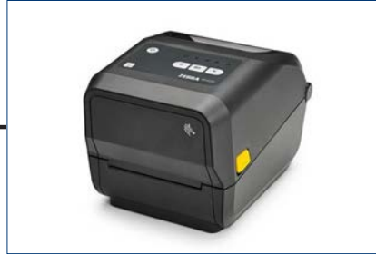
Thermodirekt-Drucker (Zebra ZD420t)