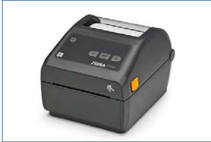
Thermotransfer-Drucker (Zebra ZD420d)