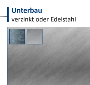
Unterbau verzinkt oder Edelstahl