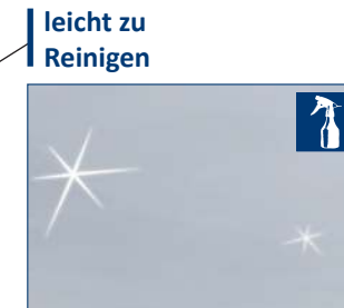
leicht zu Reinigen