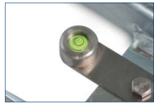
Libelle zur horizontalen Ausrichtung