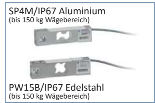
hochwertige Wägezellen für industriellen Einsatz